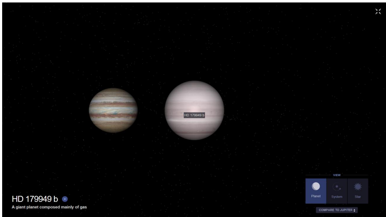
Perbandingan saiz planet HD 179949b dengan Musytari