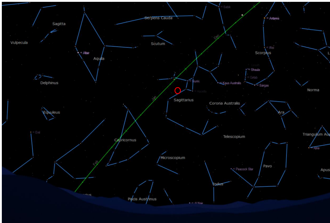
Peta kedudukan bintang HD 179949 yang berada dalam buruj Sagittarius

Tempoh peredaran orbit: 3.1 hari di Bumi