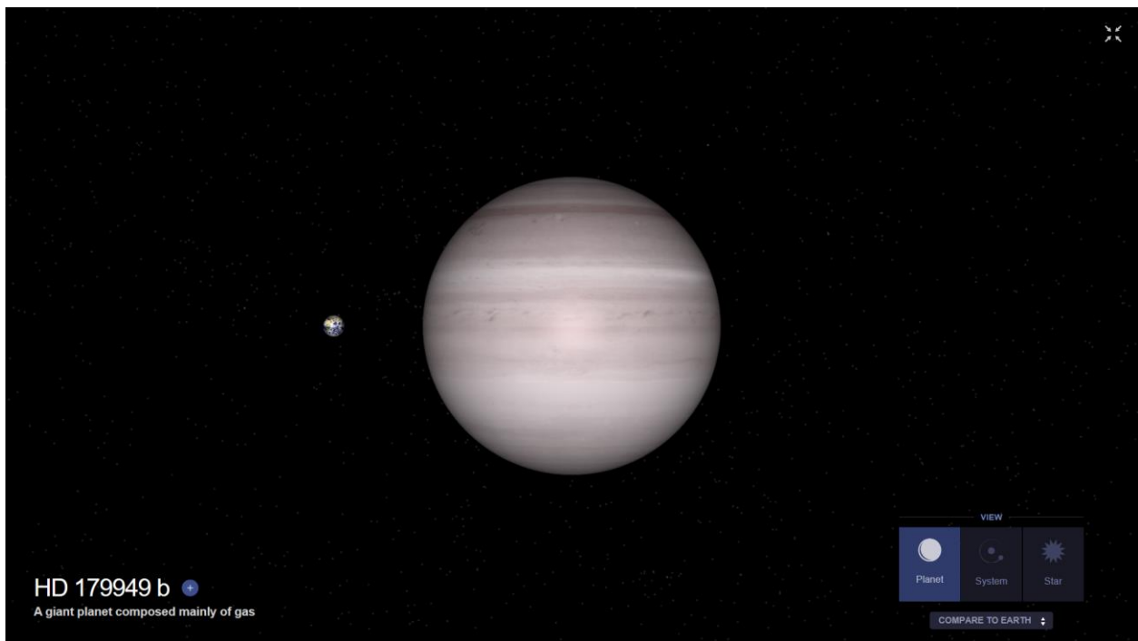
Perbandingan saiz planet HD 179949b dengan bumi